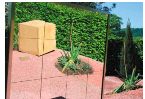
Auswege weisen den Betrachter mittels eines Spiegels auf sich selbst: „Du bist die Zukunft – gestalte sie!“

den Besucher unmittelbar erlebbar ist“, erläutert Veronika Tschersich. Und die Botschaft ist deutlich. Zentrales Gestaltungselement des Gartens ist eine sich verjüngende Holzrampe, die steil nach oben führt. Doch diesen Weg