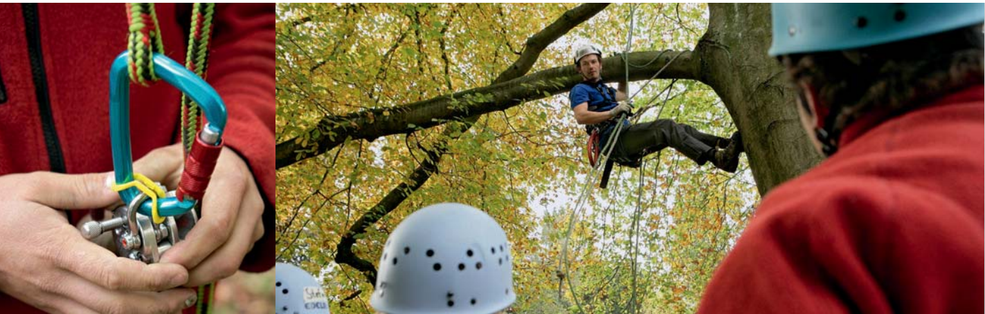
Jeder Griff muss sitzen: Kletterausbildung bei Baum und Garten