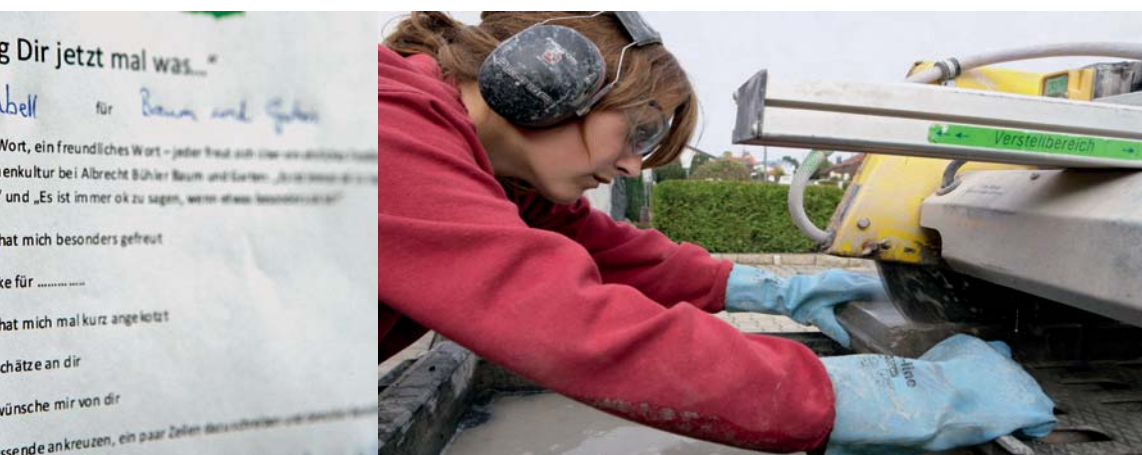
Feedbackformular bei Baum und Garten