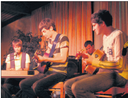
Die Band Tash aus Scharnhause spielt im Gemeindehaus zum ersten Mal vor Publikum. Die Premiere ist den jungen Musikern geglückt.